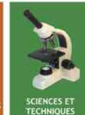
SCIENCES ET TECHNIQUES