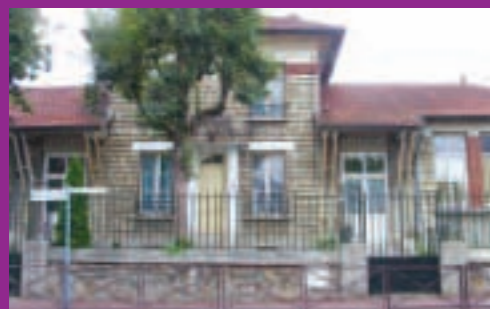
Groupe scolaire Henri-Fillette (haut et bas) 269 élèves