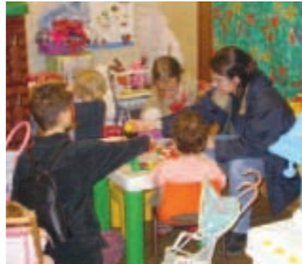
Ludothèque la Souris verte, 2 rue des Mésanges (face à l'école du Grillon).

coin jeux vidéo, vous déguiser, grimper, glisser, vous cacher dans les cabanes ou la piscine à balles. Et bien d'autres surprises... ■