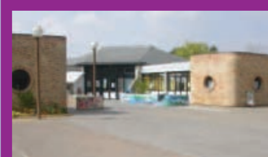
Groupe scolaire La Butte 251 élèves

temps de midi). Elles sont entièrement à la charge de la collectivité locale qui rémunère les enseignants chargés de l'étude surveillée, les animateurs responsables du temps de restauration et ceux chargés des animations éducatives et ludiques du soir. A Eragny, les enfants peuvent être accueillis dans les écoles dès 7 h du matin par des agents municipaux.