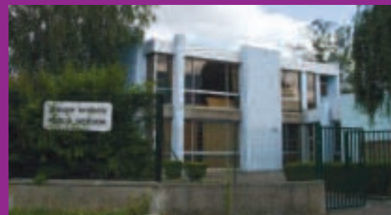
Groupe scolaire Pablo Neruda 289 élèves