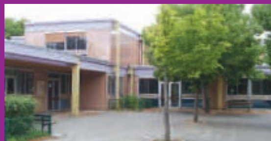
Groupe scolaire Le Bois 258 élèves