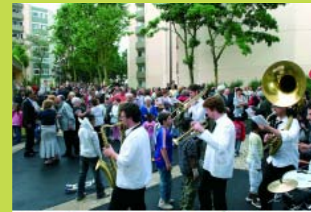
Dix Arpents rénovés