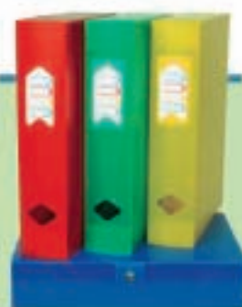
Boîte de classement Dus 7 cm 7,50 €