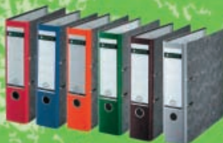
Classeur à levier carton Dus 8 cm 2,90 €