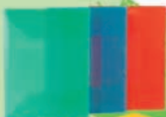
Chemise 3 rabats A4 3 €