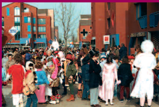
1984 - Le carnaval