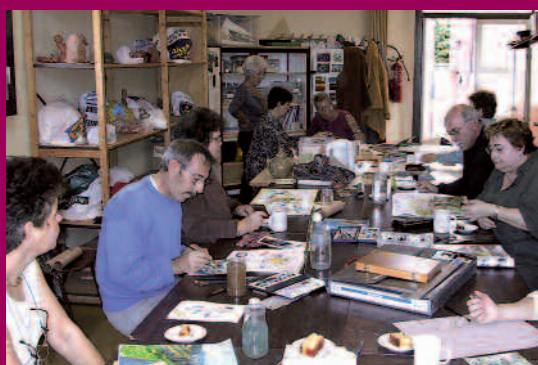
2004 - Activités associatives