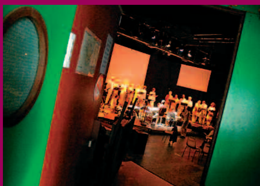
2006 - Spectacle « Dis-moi pourquoi dans le secret tu soupères et tu pleures... » à la salle Victor Jara