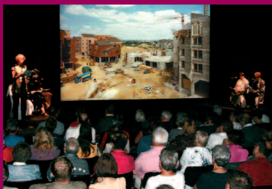
2004 - Le spectacle Mémoires d'Eragry. Présentation de la construction de la Maison de la Challe en 1978