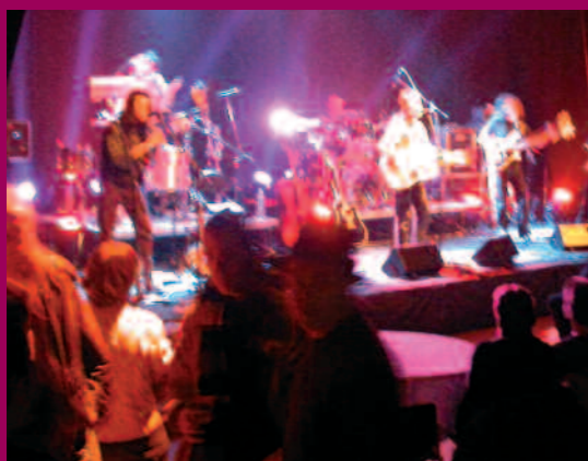
2003 - Concert à la salle Victor Jara dans la Maison de la Challe