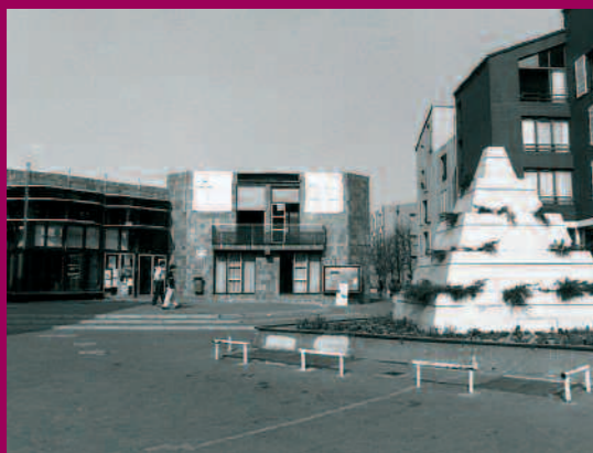
1984 - Devant la Maison de la Challe, la pyramide et sa végétation