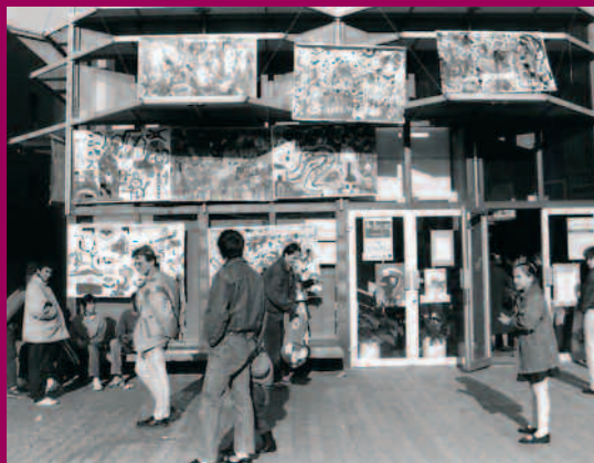
1989 - La photo de l'Art devant la Maison de la Challe