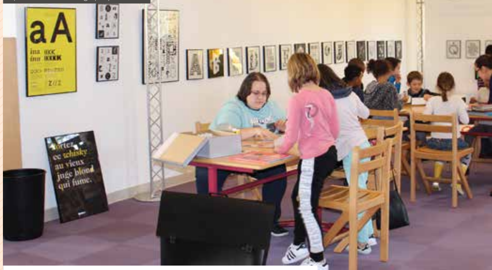
Exposition ABCDAIRE graphique — 2017

groupes «petite enfance» accueillis à la bibliothèque chaque année