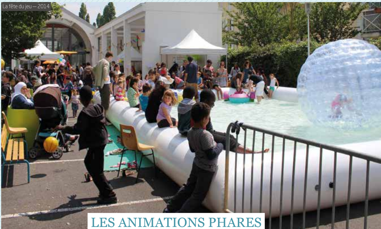
La fête du jeu — 2014