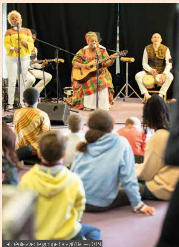
Bal créole avec le groupe Karayib'Bal — 2019

à son fonctionnement et à son dynamisme. On s'y rend pour y chercher de l'information, échanger avec les bibliothécaires, découvrir une exposition, effectuer ses démarches administratives, participer à un atelier, apprendre le tricot ou faire de nouvelles rencontres. C'est un espace intergénérationnel qui évolue et s'adapte aux modes de vie de ses usagers.