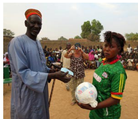
Les récompenses aux valeureuses gagnantes !