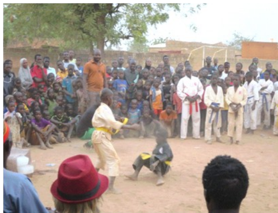
Démonstration de Karaté...