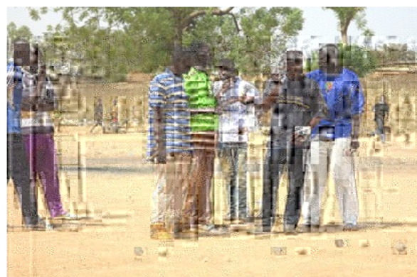
Concours de pétanque très disputé (on peut admirer le déhanché des joueurs)