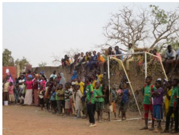
Un des matchs de foot féminin soutenu par une foule enthousiaste !