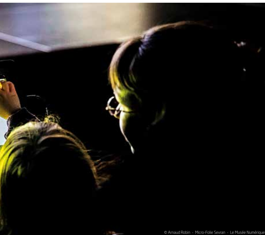
© Arnaud Robin - Micro-Folie Sevrans - Le Musée Numérique