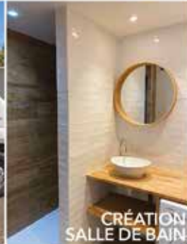
CRÉATION SALLE DE BAIN