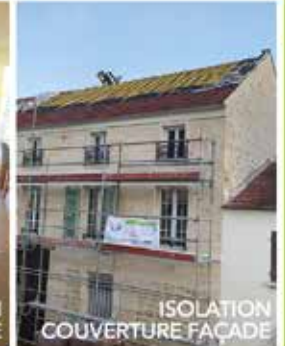
ISOLATION COUVERTURE FAÇADE